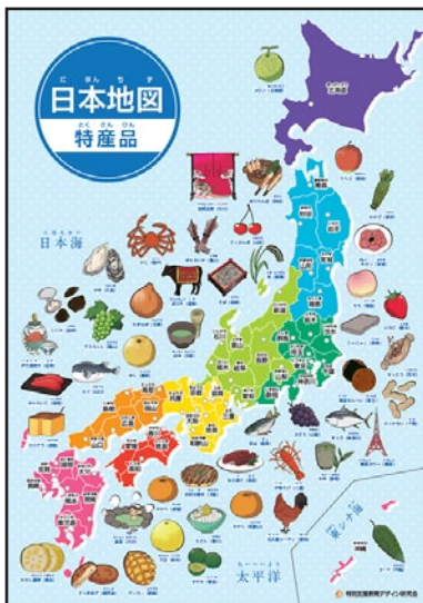
▲プリント教材 「日本地図」1枚目「特産品」