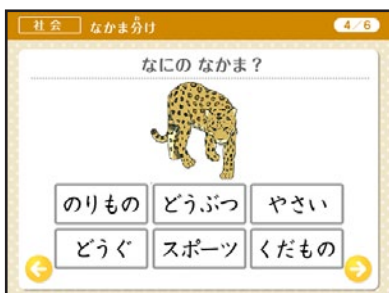
▲WEB コンテンツ 「なかま分け」