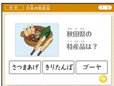
▲WEBコンテンツ 「日本の特産品」