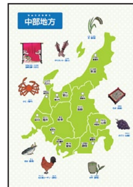
▲プリント教材／触覚プリント 「日本地図触覚カード」